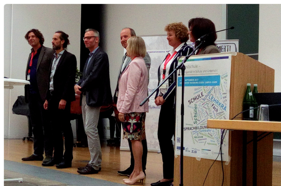
Referenten sowie Gastgeber Uni Duis- burg Essen, Kompetenzteam Mülheim/Oberhau- sen und Essen, RuhrFutur