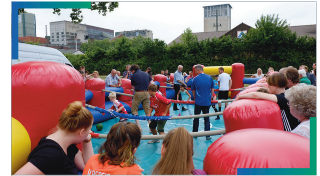
Familienfest Westerholt, gefördert vom Quartiersfonds