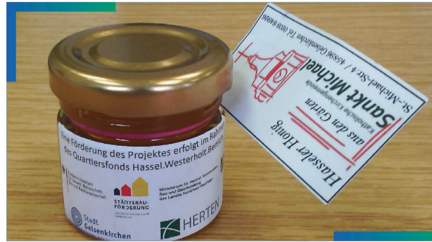
Hasseler Honig, finanziert mit Hilfe des Quartiersfonds

Über Ihren Antrag und die Vergabe der Gelder entscheidet der Gebietsbeirat. Antworten auf alle Ihre Fragen zum Quartiersfonds erhalten Sie im Stadtteilbüro.