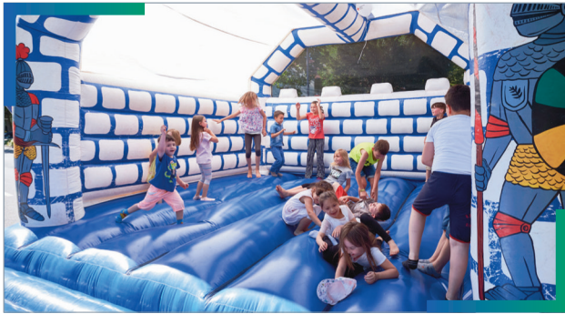
Die Hüpfburg aus dem Quartiersfonds in Aktion